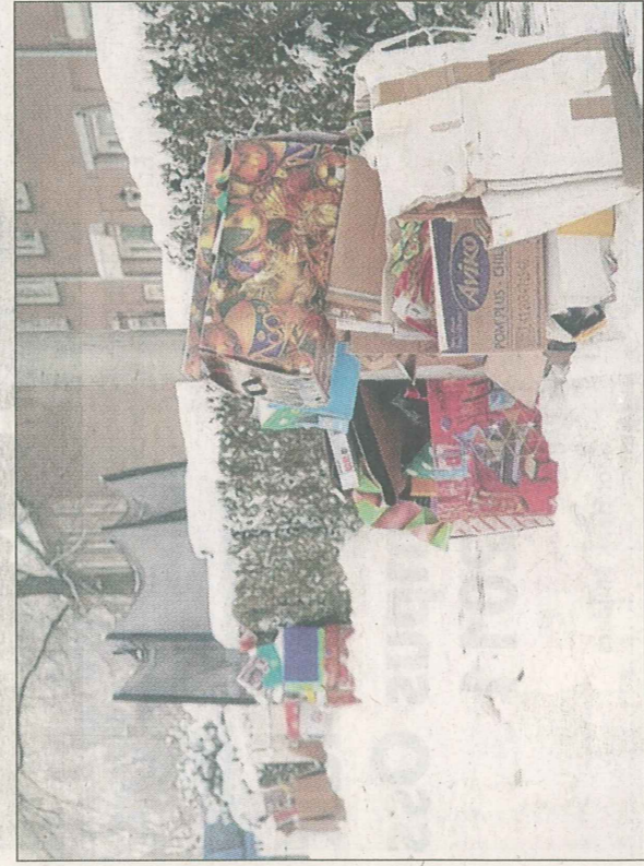
In de Staatsliedenbuurt stonden her en der nog vele dozen oud papier buiten.